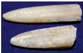
Вымерший головоногий моллюск белемнит; ростры белемнитов