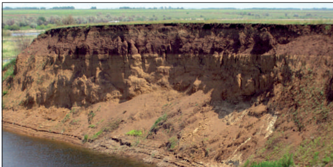
Обрывистый берег реки в Правобережье

Приходилось ли тебе видеть в нашем крае обрывистый берег реки? Если да, то наверняка ты заметил, что он состоит из нескольких слоёв, которые то утолщаются, то, наоборот, сужаются.